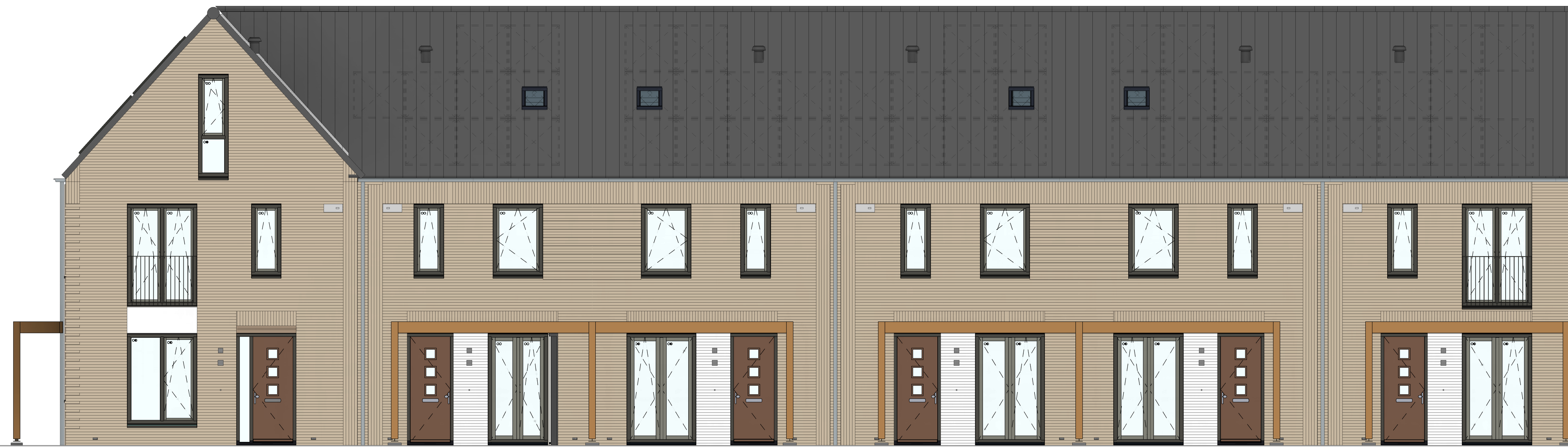
voorgevel 1 : 50