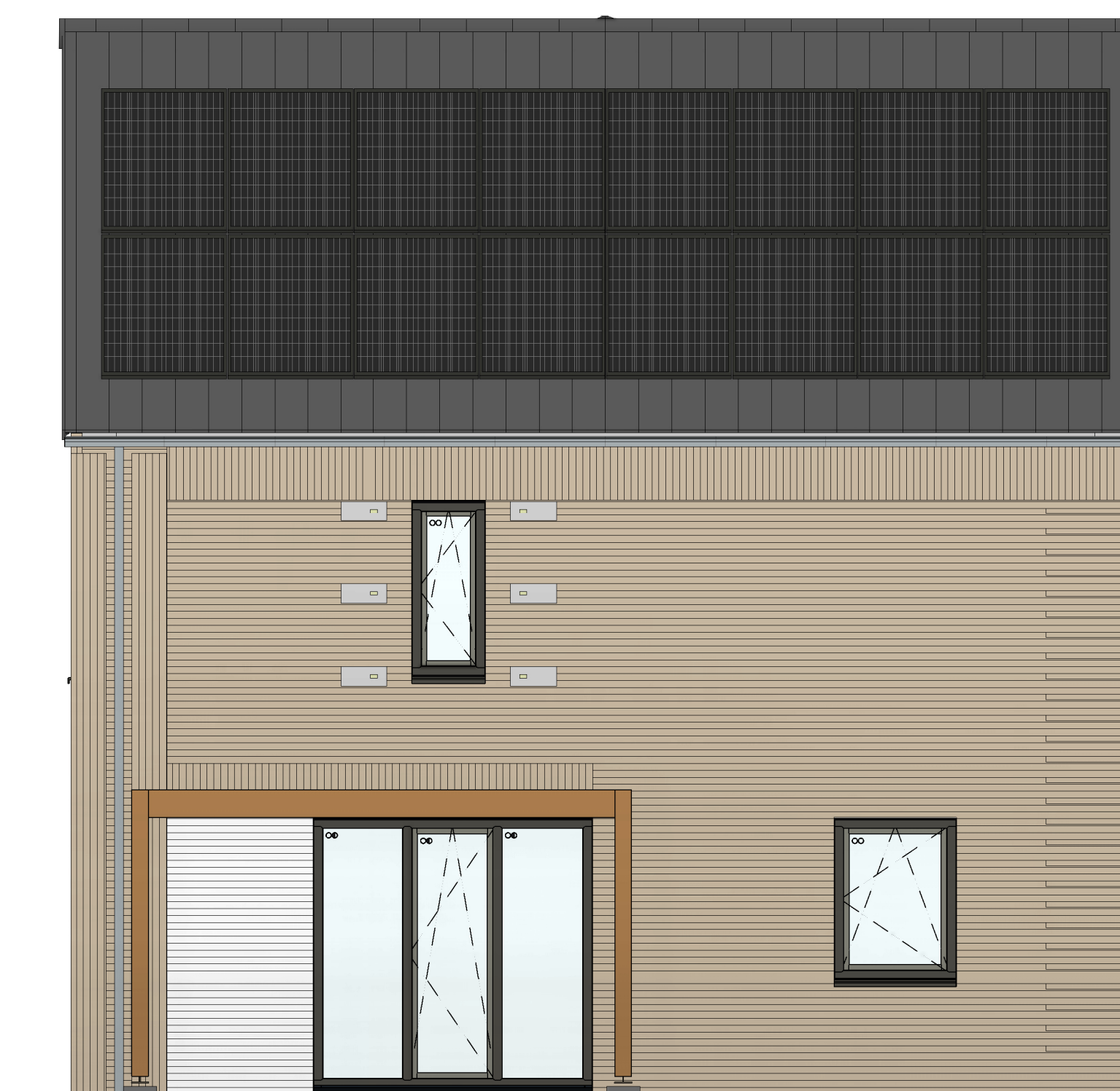
linkerzijgevel 1 : 50