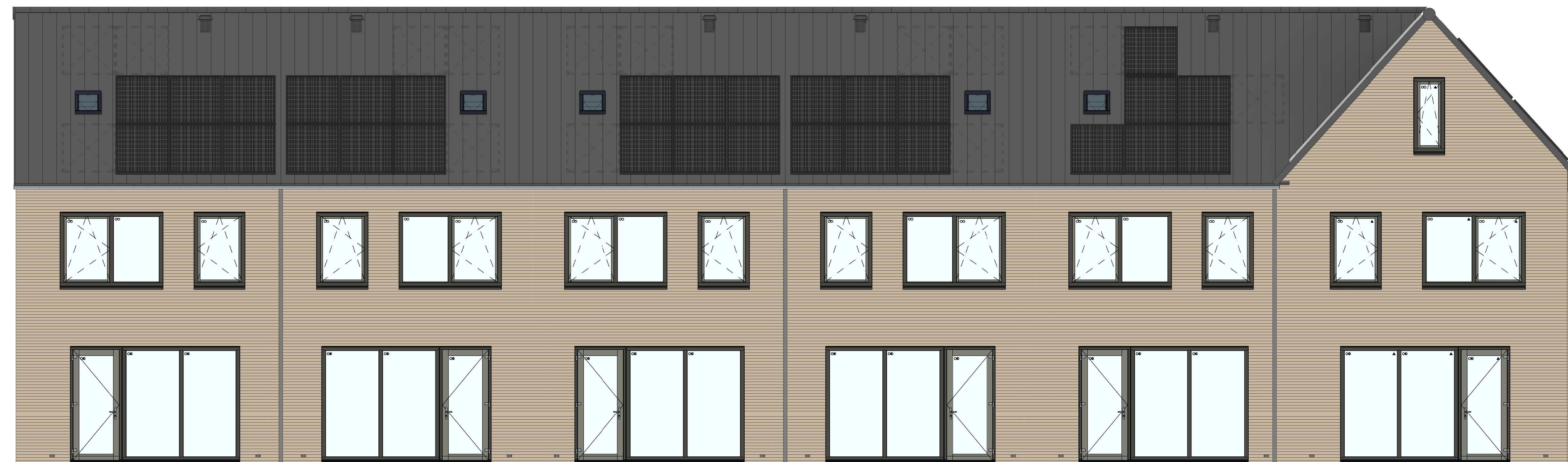
achtergevel 1 : 50