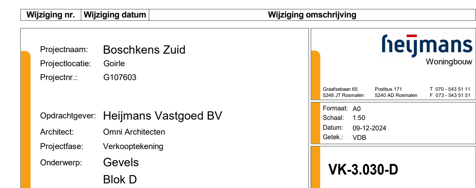
linkerzijgevel 1 : 50